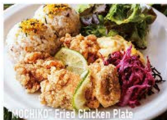
Mochiko Fried Chicken Plate

ハワイ州観光局公認プログラム "111-HAWAII AWARD" ハワイフード・ロコモコ部門 アロハテーブル・ワイキキのロコモコが1位受賞!