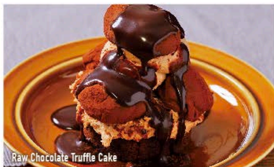
Raw Chocolate Truffle Cake