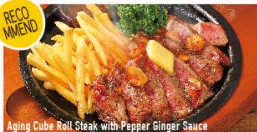
Aging Cube Roll Steak with Pepper Ginger Sauce

熟成キューブロールステーキ 1790 ペッパージンジャーソース (税込 1933)