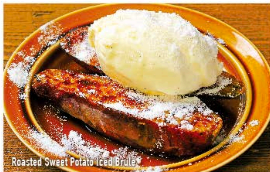
Roasted Sweet Potato Iced Brulee