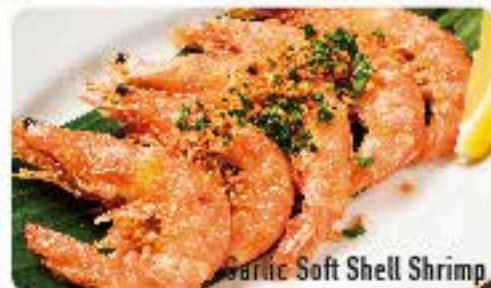
Garlic Soft Shell Shrimp