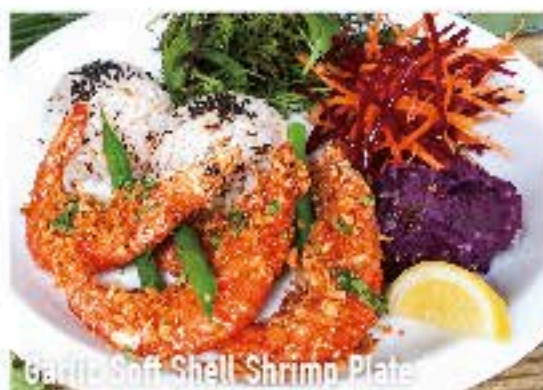
Garlic Soft Shell Shrimp Plate