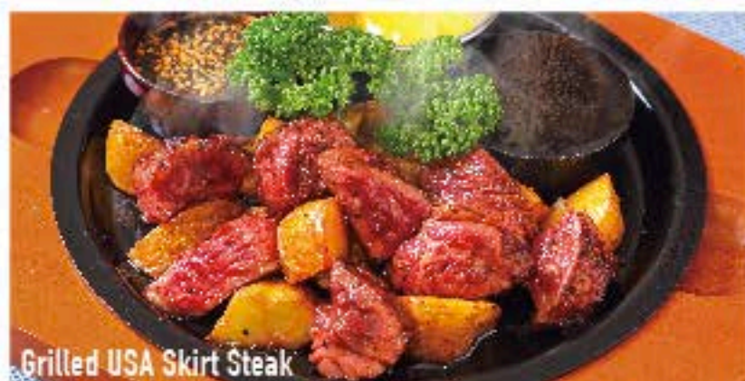
Grilled USA Skirt Steak

USA 厚切りハラミグリル 1580 柔らかジューシー厚切りハラミ肉を特製ソースで。 (税込 1706)