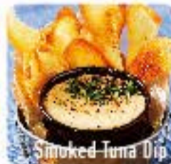
Smoked Tuna Dip